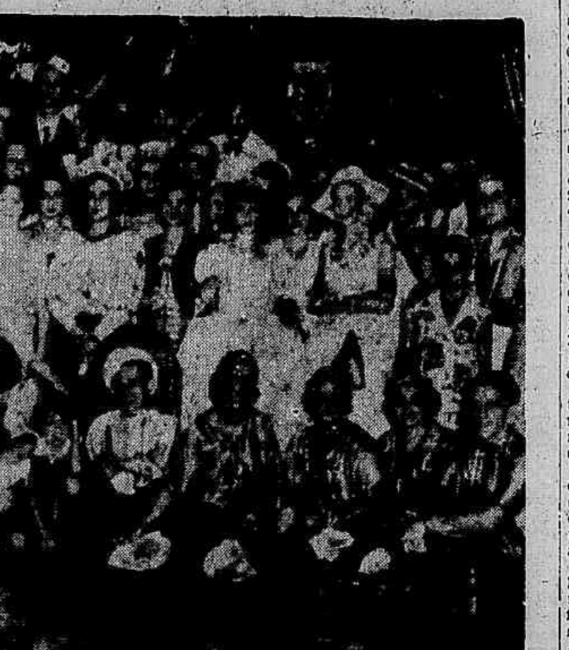
Um lindo grupo tirado nos salões do Dopelavore, no baile de 'Ante-homen'.